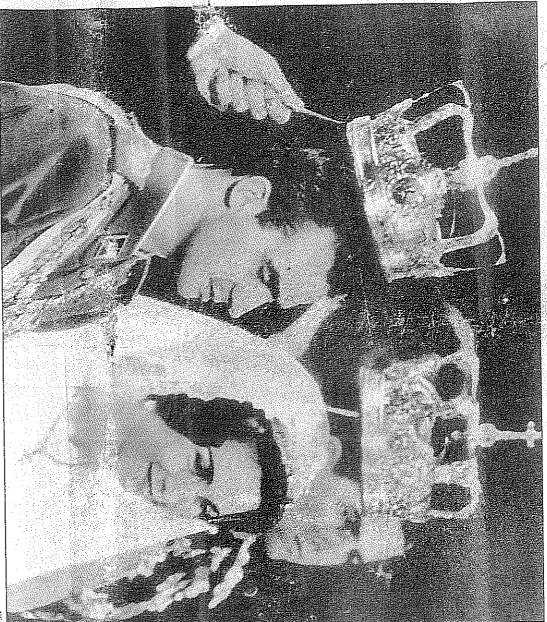
Juan Carlos de Borbón y Sofía de Grecia, durante la ceremonia católica en la catedral de San Dionisio de Atenas.